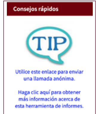
Imagen de el enlace de Consejos rápidos en el web sitio

Los consejos pueden ser anónimos, o puedes provenir la información de contacto. Se puede usar Consejos rápidos también, para archivar una queja de DASA, en que en este caso la información de contacto es obligatoria.